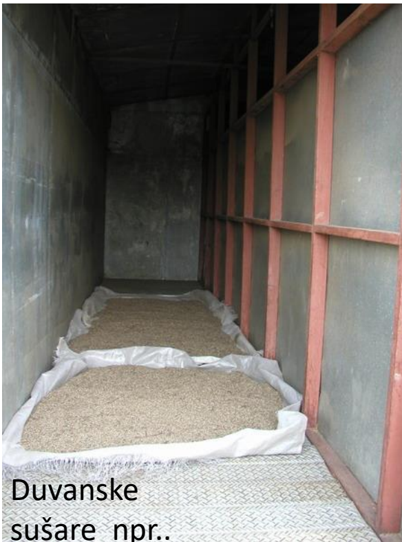
Duvanske sušare npr..