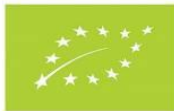
Logotip Evropske Unije za organski proizvod

Сваки сертификат садржи број који је додељен сваком произвођачу приликом склапања уговора о сертификацији.